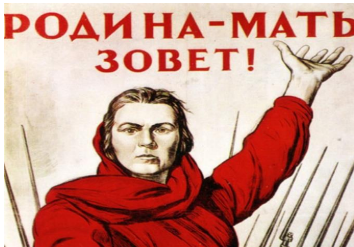
Плакат с призывом: «Родина – мать зовет!»

Источник В: Плакат, созданный в годы Великой Отечественной войны.